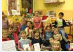
NOC S ANDERSENEM strana 7