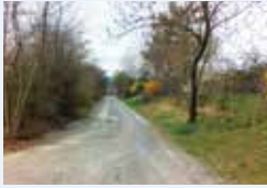
ÚZEMNÍ PLÁN strana 4