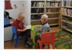
KNIHOVNA PRO DĚTI strana 10