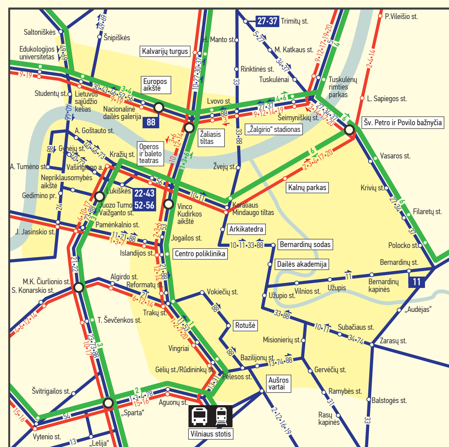
CENTRINĖ MIESTO DALIS CITY CENTRE AREA